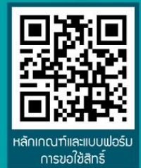
คลิกที่ภาพและแบบฟอร์มการขอใช้สิทธิ์

ต้องแจ้งยกเลิกภายใน 30 วัน นับตั้งแต่วันที่สิ้นสุดความจำเป็น